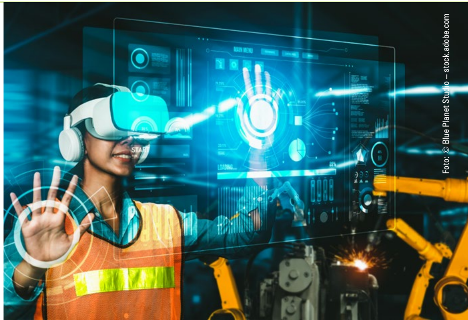
In manchen Fällen eignen sich Brillen, die eine virtuelle Realität simulieren, zum lernen. So kann zum Beispiel die Reihenfolge der Handgriffe angezeigt werden.

Hier die passenden Lösungen zu erarbeiten kostet am Anfang einiges an Zeit und Energie, die jedoch im Nachhinein wieder eingespart werden. Deswegen ist