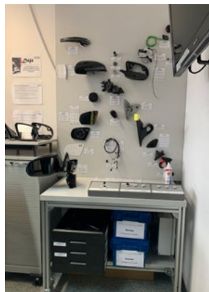
Für die Autospiegel-Montage bei Magna erhalten neue Mitarbeiter in speziellen Schulungsräumen Produktkenntnisse und lernen, spezifische Fachbegriffe zu verstehen.