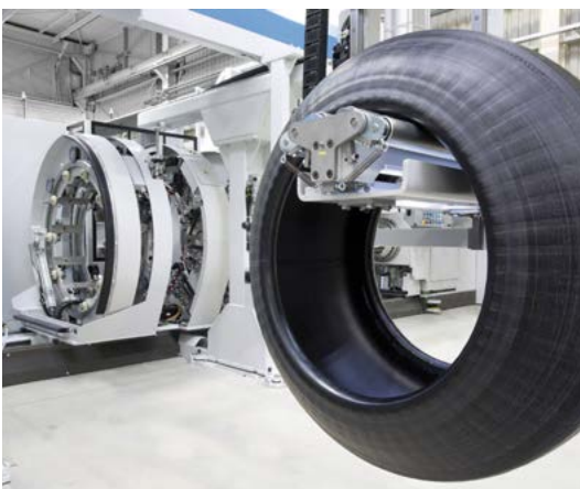
LKW-Reifen müssen mindestens eine Million Kilometer laufen; deshalb sind Hersteller konservativ und mit Änderungen ihres Produktionsverfahrens sehr vorsichtig.