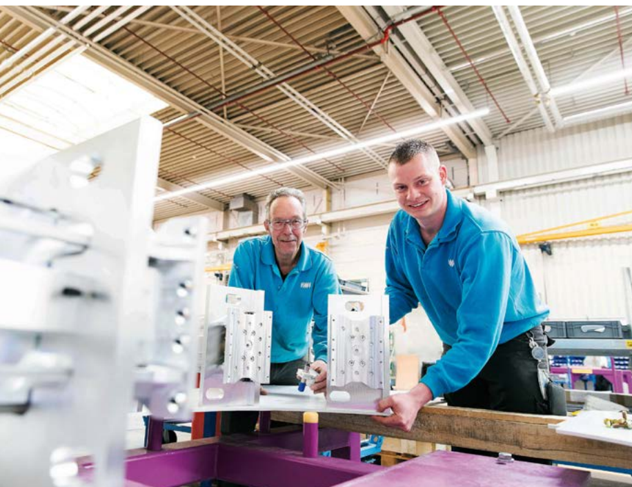
Untersuchungen zeigen, dass ein Training am wirksamsten ist und sich am besten einprägt, wenn das Gelernte möglichst schnell nach dem Training angewandt wird.

„In der Anlaufwoche lernen neue Mitarbeiter alle elementaren Tätigkeiten für die Arbeit in den Fabrikhallen. Hier wird etwa Platz eingeräumt für HSE-Training (Gesundheit, Sicherheit und Umwelt), aber es finden auch Simulationstrainings des