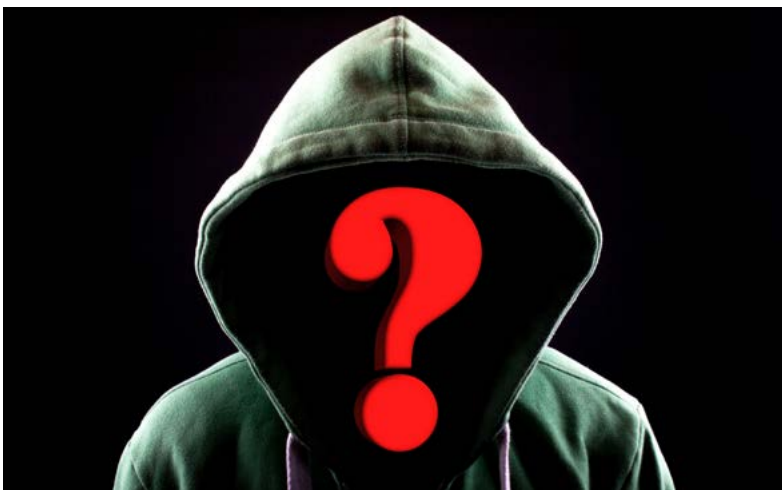
Wieviele Menschen stecken in KI-Lösungen?

Insgesamt scheint künstliche Intelligenz nützlich zu sein, wenn man viele Daten über viele Wiederholungen (d. h. viele gemessene Variablen für viele hergestellte Produkte) hat, aus denen die KI lernen kann, und wenn eine 100%-ige Genauigkeit