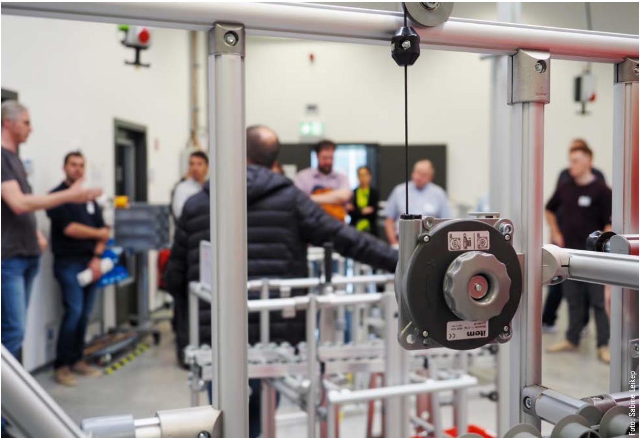
Karakuri-Lösungen zum Anfassen wurden auf dem ersten Karakuri-Praktikertag im Mai 2022 in der Lehrfabrik des CETPM präsentiert.