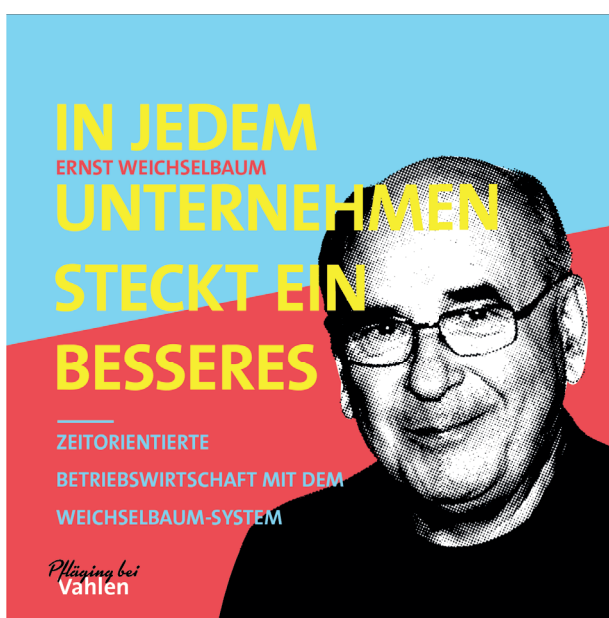
Dank der kompakten Form eignet sich das Werk als "ständiger Begleiter".