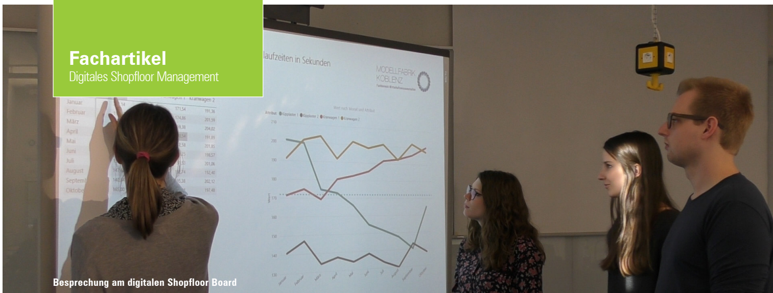
Besprechung am digitalen Shopfloor Board