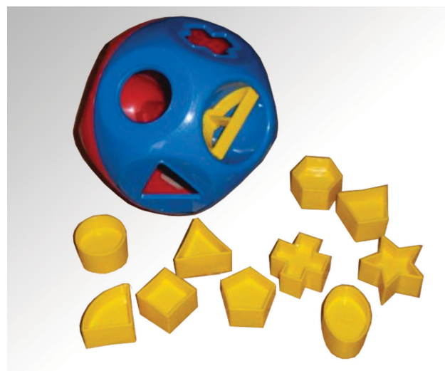
Abb. 4: Früh übt sich ... das Poka-Yoke-Prinzip „kinderleicht“

Wenn Sie genau wissen wollen, was Poka Yoke ist, dann fragen Sie doch einfach das jüngste Mitglied Ihrer Familie (s. Abb. 4 unten).