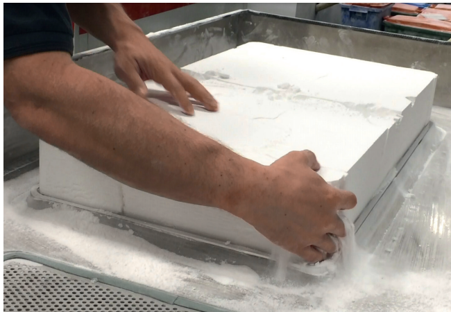
Abb. 4: Das fertige Bauteil wird aus dem Pulverbett ausgepackt. Pulverreste werden abgesaugt und können wiederverwendet werden.