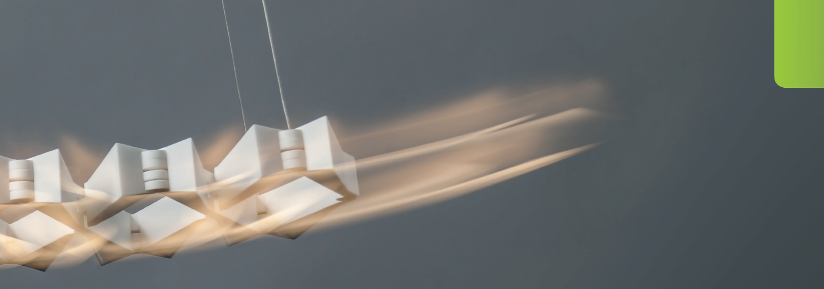
Abb. 1: Ein Produkt, das von der Entwicklung bis zum Einsatz beim Kunden der Lean-Philosophie gerecht wird.