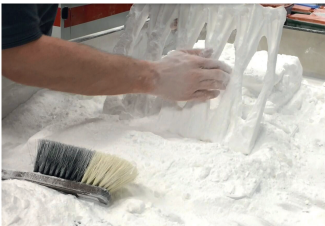
Abb. 5: Der Leuchtenkörper ist sofort funktionsfähig und damit auf 1,4 m vergrößerbar. Er wird von Hand und per Druckluft vom Pulver gereinigt.