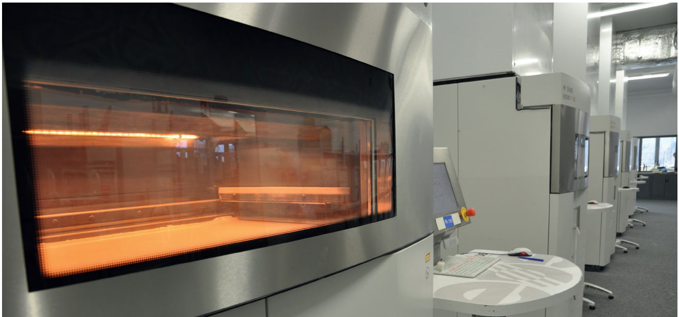
Abb. 3: Der Lasersinterdrucker baut den Leuchtenkörper Schicht für Schicht im zehntel Millimeterbereich auf.

Fertigung, wo – wie in einem Sandkasten – eine dünne Schicht eines Pulverwerkstoffes auf die Bauplattform aufgetragen wird. Ein Laserstrahl schmilzt das Pulver exakt und im \mu -Bereich an den Stellen, die ihm durch die Konstruktionsdaten vorgeben werden. Danach senkt sich die Fertigungsplattform ab und es erfolgt der nächste Pulverauftrag. Dieses wird erneut per Laser geschmolzen und verbindet sich mit der darunterliegenden Schicht. So wird XMOOVE Schicht für Schicht aufgebaut. Alles was nicht verschmolzen wurde, bleibt als loses Pulver bestehen und dient dem Rest als Stützmaterial, ein großer Vorteil gegenüber anderen 3D-Druckverfahren.