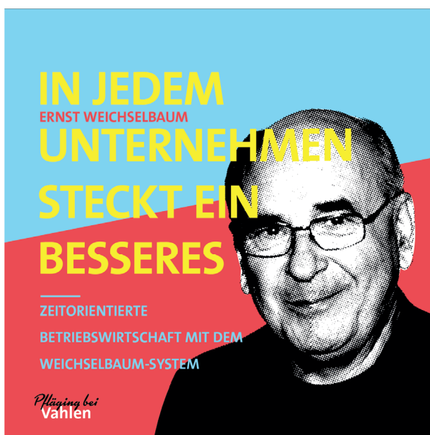
Dank der kompakten Form eignet sich das Werk als "ständiger Begleiter".